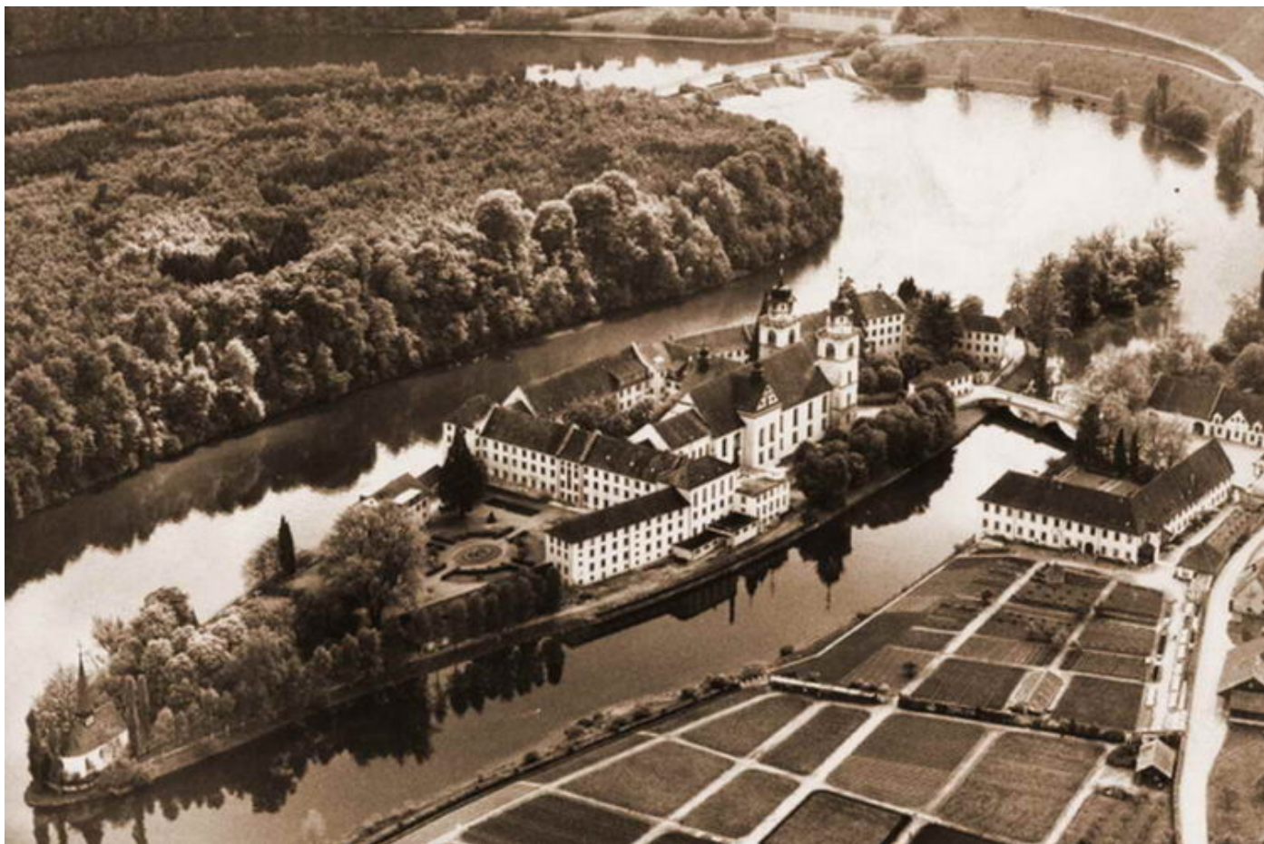
Altes Bild Rheinau Irrenanstalt