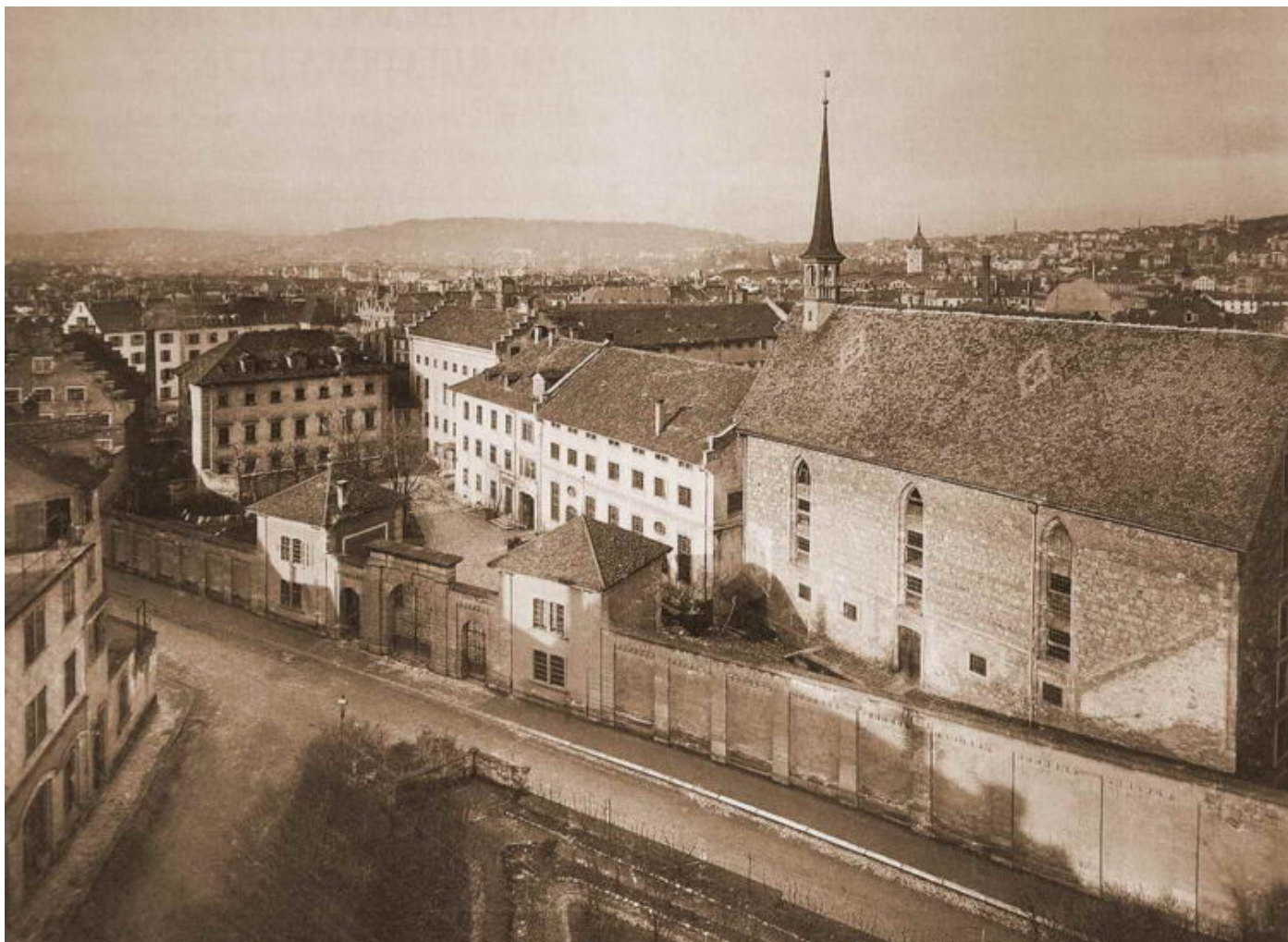
Oetenbach Strafanstalt um 1900