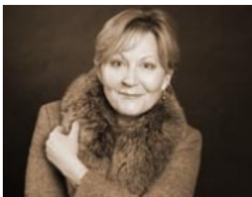
Elisabeth Florin

Rattenlinien (englisch rat lines) war die von US-amerikanischen Geheimdienst- und Militärkreisen geprägte Bezeichnung für Fluchtrouten führender Vertreter des NS-Regimes, Angehöriger der SS und der Ustascha nach dem Ende des Zweiten Weltkrieges. Aufgrund einer aktiven Beteiligung hochrangiger Vertreter der katholischen Kirche an den Fluchtrouten trugen sie bis zur Beteiligung des US-amerikanischen Geheimdienstes den Namen „Klostertrouten“.