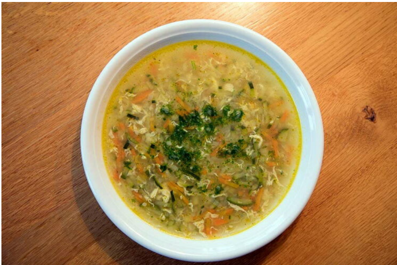
Cindy Blackman's Spring Soup – daraus schöpft die Drummerin ihre Power!

Das Buch kann nicht nur allen musikliebenden Kochfans wärmstens empfohlen werden!