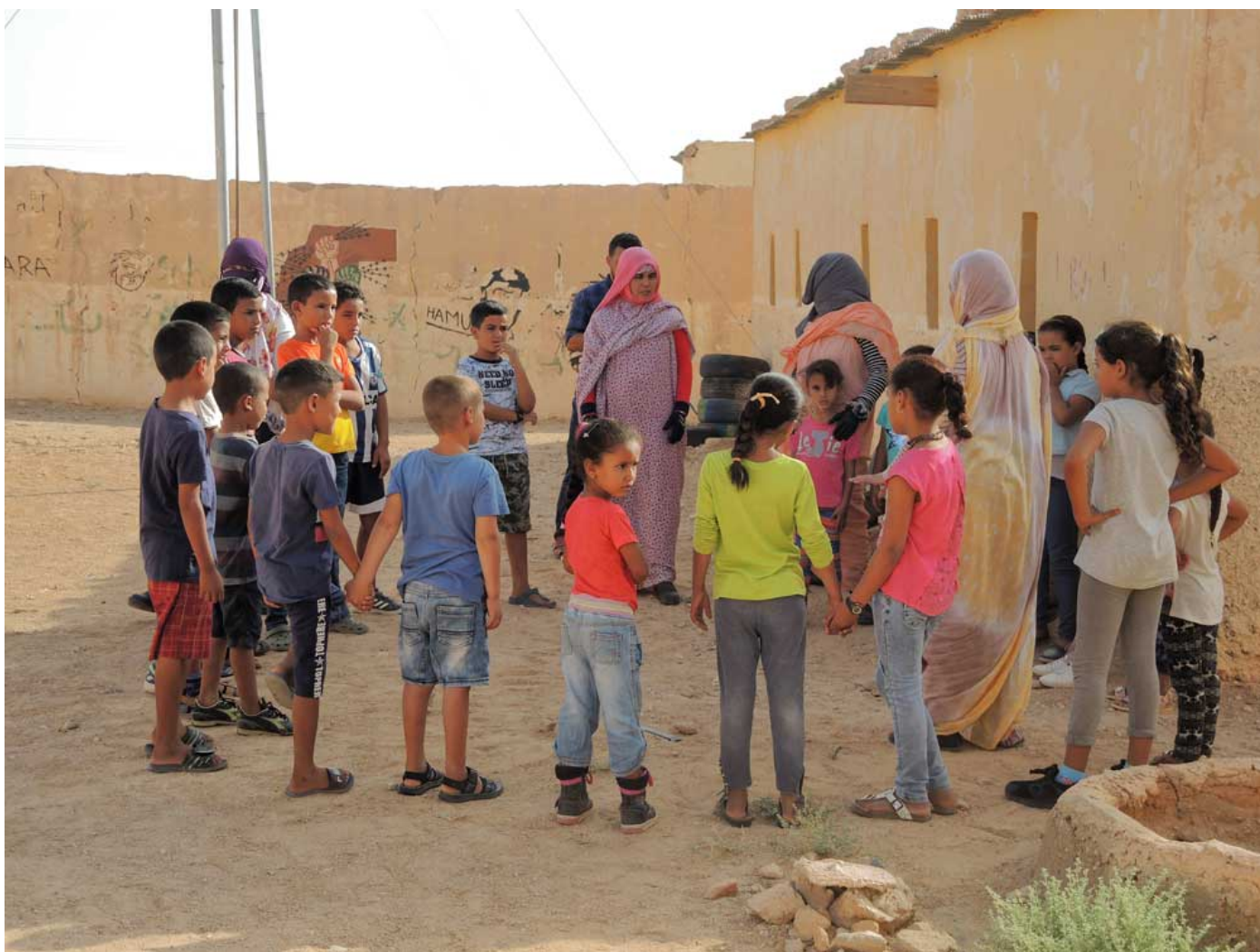
Smara Programm-Scouts