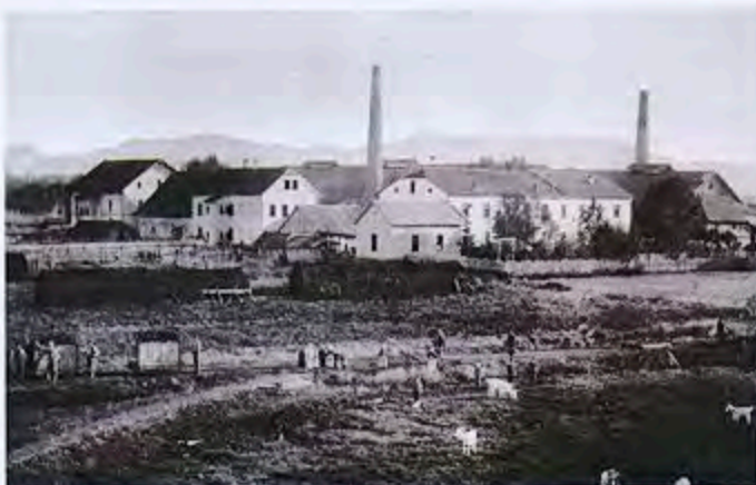
Bürmoos um 1895

Der Prager Unternehmer Ignaz Glaser ließ 1881 in der unbewohnten und von den Bauern gemiedenen Moorlandschaft im Norden von Salzburg eine Tafelglasfabrik und eine Ziegelei erbauen.