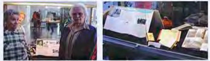
Das Schicksal von Ur-Bürmoosern, Vertriebenen, Geflüchteten und Zugezogenen thematisierte auch die Ausstellung "Vertrieben - Neue Heimat in Bürmoos", die im Rahmen des Symposiums zu sehen war.

Zum Ausklang der Eröffnung waren alle Gäste zum Rundgang durch die Ausstellung "Vertrieben - Neue Heimat Bürmoos" eingeladen. Die Ausstellung wurde vom Verein Geschichte Bürmoos gestaltet.