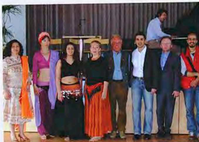
Aus Hallein waren Bauchtänzerinnen mit türkischer und mit österreichischer Herkunft nach Bürmoos gekommen.

Die EuRegio Salzburg-Berchtesgadener Land-Traunstein bietet eine gute Voraussetzung für grenzüberschreitende Kooperationen im Bereich der Integration. Sowohl das EuRegio-Forum für Integration als auch das Ignaz-Glaser-Symposium sollen zu ständigen Einrichtungen werden.