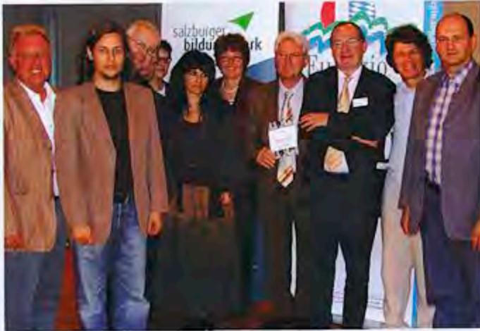
Im Bild TeilnehmerInnen der Workshops.

Am Nachmittag diskutierten die TeilnehmerInnen in vier Workshops über die Chancen und Schwierigkeiten sowie Lösungsansätze und Gestaltungsmöglichkeiten für das Miteinander der Kulturen.