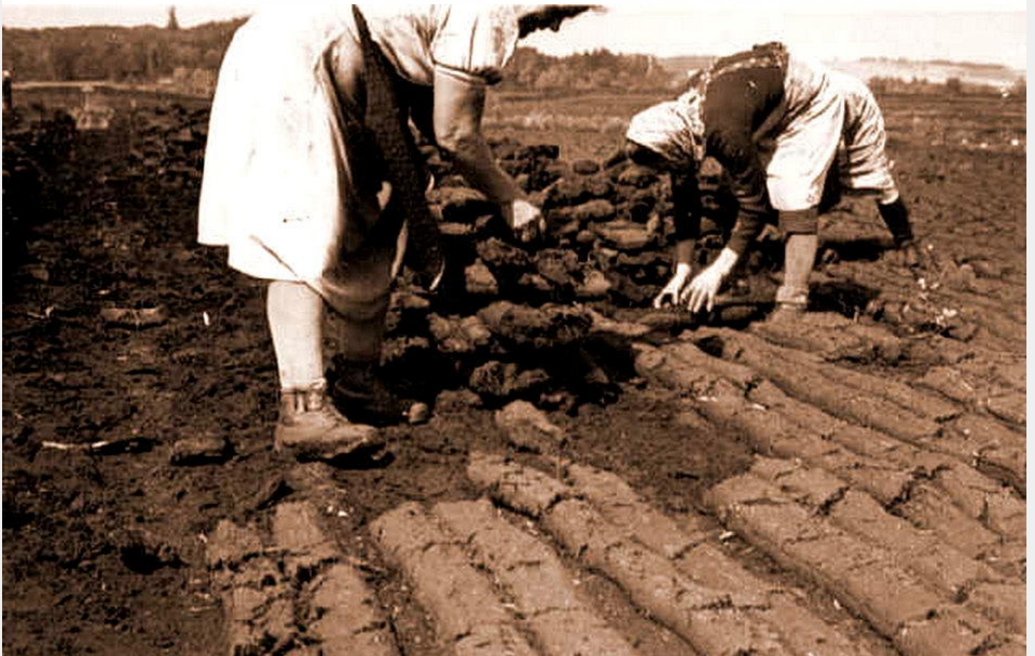
Frauen beim Kasteln der Torfwasen