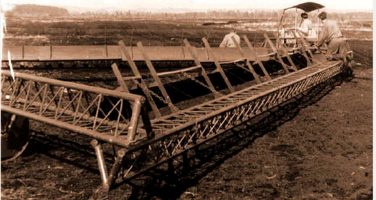
Maschineller Torfabbau 1959 - Konstrukteur Ing. Wilhelm Lustig