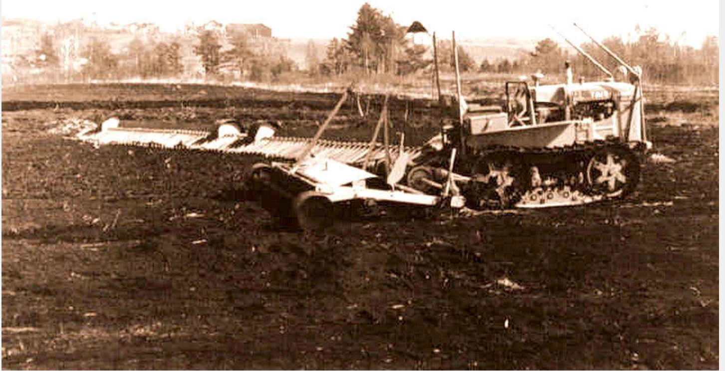
Umgebauter Steyr - Traktor