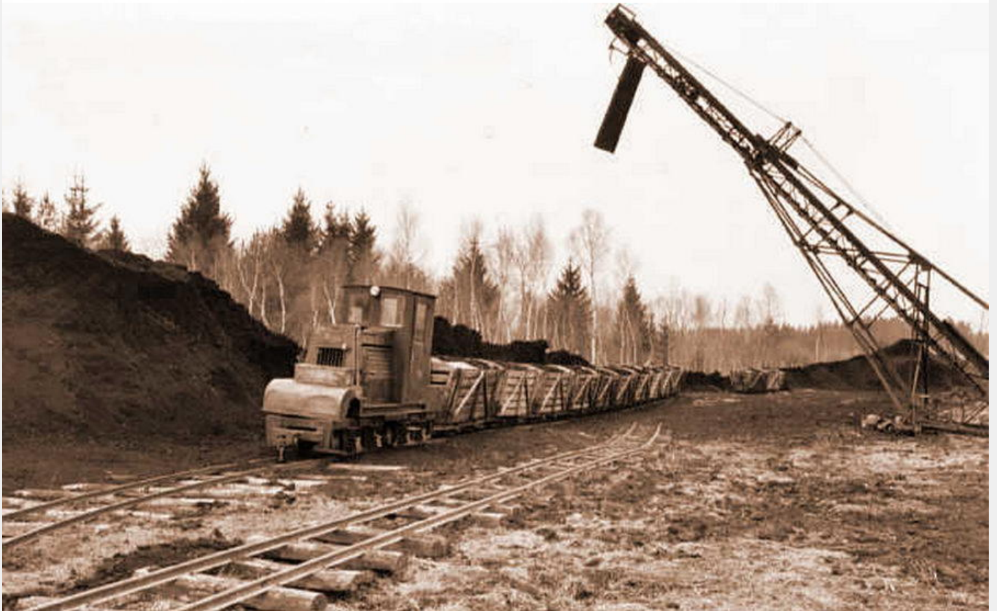
Bockerlbahn mit Torfhalde 1959