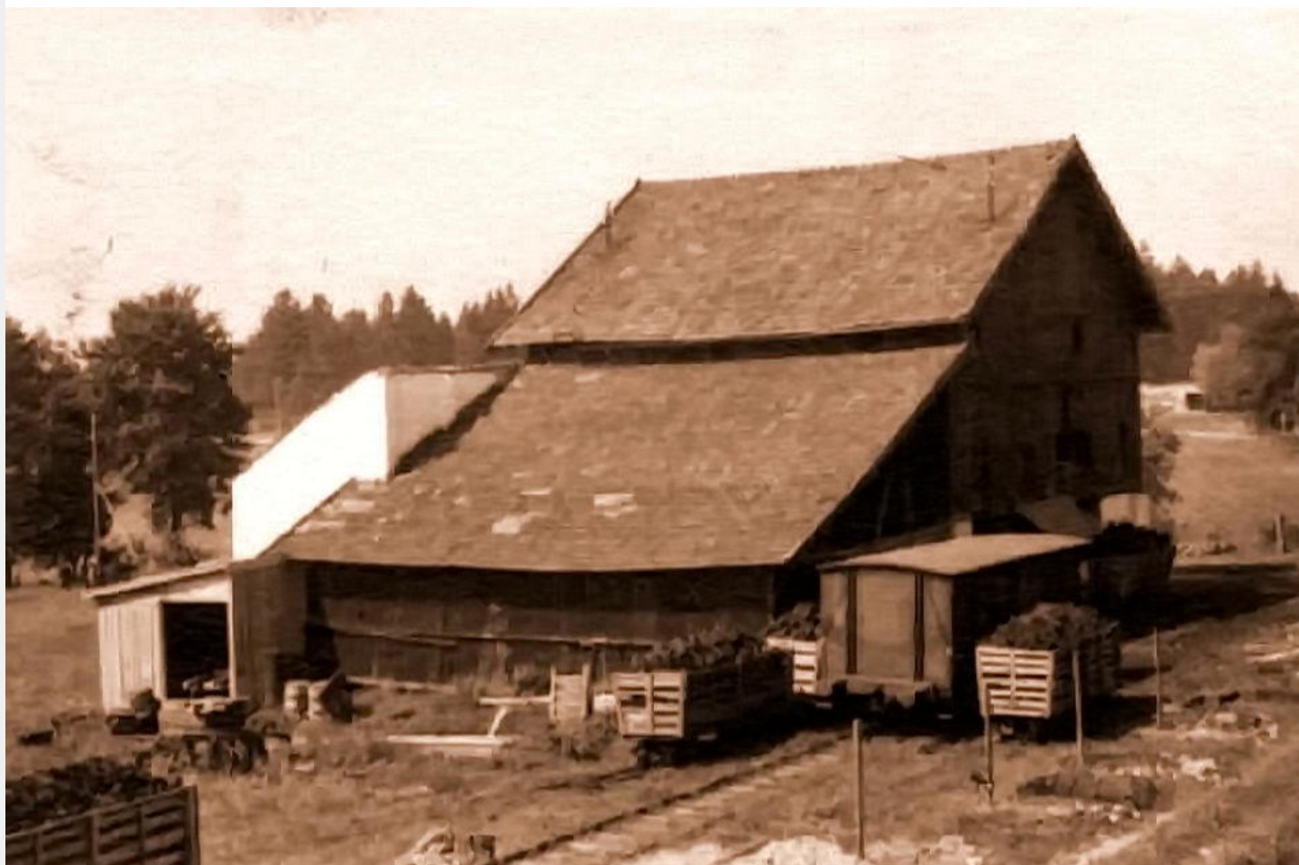
Das Torfwerk in Zehmemoos um 1947