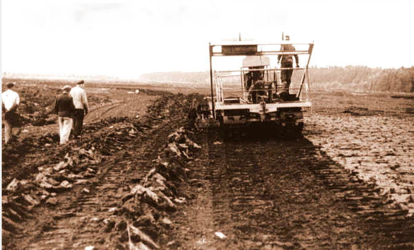
Maschineneinsatz im Torffeld 1953